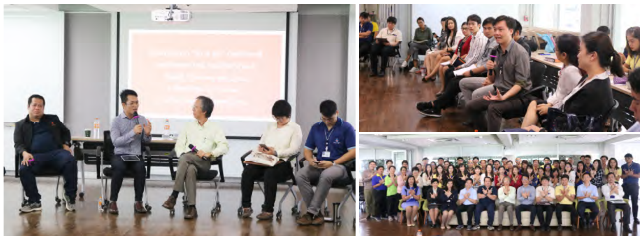
ครั้งที่ 1 อธิการบดีพบประชาคมคณะวิทยาศาสตร์ วันพุธที่ 7 สิงหาคม 2562 เวลา 09:30 น. – 11:30 น. ณ ห้องประชุม Science Connect คณะวิทยาศาสตร์