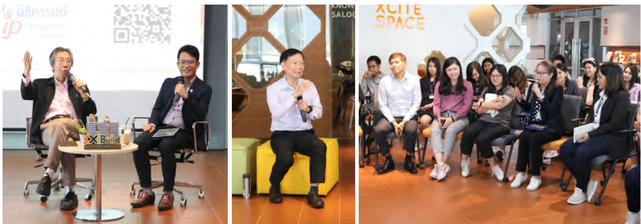
ครั้งที่ 13 อธิการบดีพบประชาคมจากสำนักเคเอกซ์ วันอังคารที่ 26 พฤศจิกายน 2562 เวลา 09.30 – 11.30 น. ณ ห้องประชุม ชั้น 17 อาคารเคเอกซ์