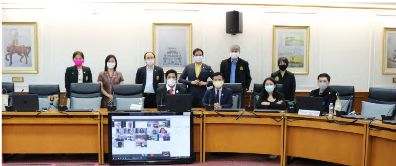
ประชุมประธานสภาอาจารย์มหาวิทยาลัยแห่งประเทศไทย (ปอมท.) สมัยสามัญ ครั้งที่ 4/2563 ในวันศุกร์ที่ 24 เมษายน 2563 ณ ห้องประชุม ศ.นพ. นที รัชัฎพลเมือง ชั้น 5 สำนักงานอธิการบดี มหาวิทยาลัยมหิดล ศาลายา จังหวัดนครปฐม