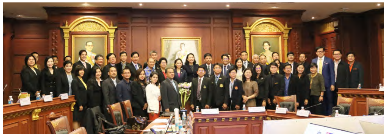
ประชุมประธานสภาอาจารย์มหาวิทยาลัยแห่งประเทศไทย (ปอมท.) สมัยสามัญ ครั้งที่ 8/2562 ในวันเสาร์ที่ 24 สิงหาคม 2562 ณ ห้องประชุมสิริวิวัฒนภักดี ชั้น 11 อาคารนราธิปพงศ์ประพันธ์ สถาบันบัณฑิตพัฒนบริหารศาสตร์