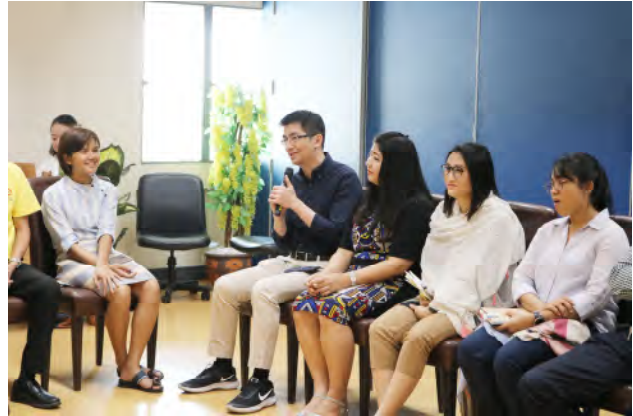
ครั้งที่ 8 อธิการบดีพบประชาคมบัณฑิตวิทยาลัยการจัดการและนวัตกรรม(GMI) วันพฤหัสบดีที่ 3 ตุลาคม 2562 เวลา 13.30 – 15.30 น. ณ ห้องประชุมคณะฯ ชั้น 8 อาคารเรียนรวม 5