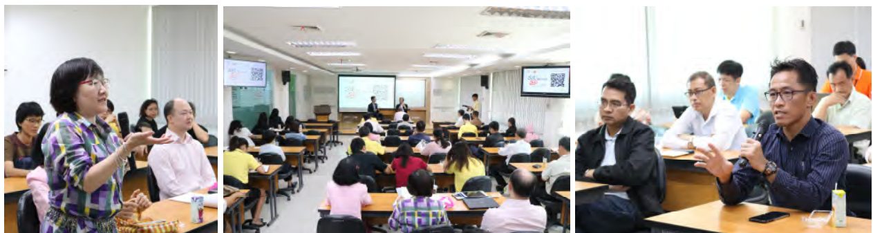
ครั้งที่ 7 อธิการบดีพบประชาคมคณะพลังงานสิ่งแวดล้อมและวัสดุ วันอังคารที่ 1 ตุลาคม 2562 เวลา 13.30 – 15.30 น. ณ ห้องประชุมปรีดา วิทยาลัยสวัสดิ์ ชั้น 2 อาคารปฏิบัติการ 11 คณะพลังงานสิ่งแวดล้อมและวัสดุ