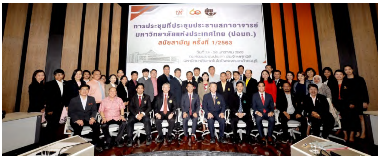
ประชุมประธานสภาอาจารย์มหาวิทยาลัยแห่งประเทศไทย (ปอภท.) สมัยสามัญ ครั้งที่ 1/2563 ในวันเสาร์ที่ 25 มกราคม 2563 ณ ห้องประชุมประกาย ประจักษ์ศุภนิติ (AD-907) ชั้น 9 อาคารสำนักงานอธิการบดี มหาวิทยาลัยเทคโนโลยีพระจอมเกล้าธนบุรี