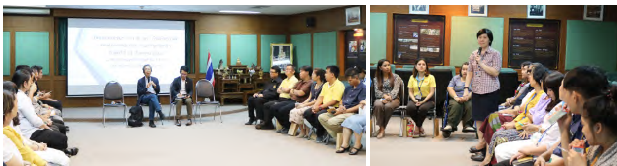
ครั้งที่ 3 อธิการบดีพบประชาคมคณะครุศาสตร์อุตสาหกรรมและเทคโนโลยี วันศุกร์ที่ 23 สิงหาคม 2562 เวลา ณ ห้องประชุม หอเกียรติยศ ชั้น 8 คณะครุศาสตร์อุตสาหกรรมและเทคโนโลยี (CB3)