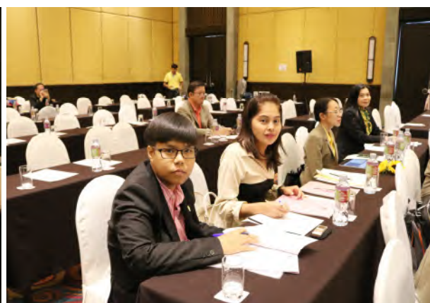
ประชุมประธานสภาอาจารย์มหาวิทยาลัยแห่งประเทศไทย (ปอมท.) สมัยสามัญ ครั้งที่ 10/2562 ในวันเสาร์ที่ 25 ตุลาคม 2562 ณ ห้องประชุมแปซิฟิก โรงแรมเดอะไทด์ รีสอร์ท จังหวัดชลบุรี