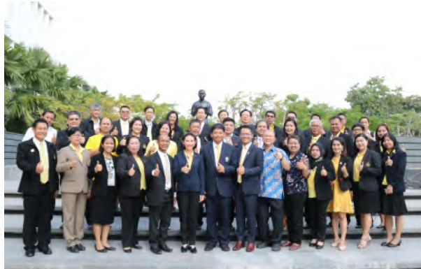
ประชุมประธานสภาอาจารย์มหาวิทยาลัยแห่งประเทศไทย (ปอมท.) สมัยสามัญ ครั้งที่ 7/2563 ในวันเสาร์ที่ 20 กรกฎาคม 2562 ณ ห้องประชุมประกาย ประจักษ์ศุภานิติ (AD-907) ชั้น 9 อาคารสำนักงานอธิการบดี มหาวิทยาลัยเทคโนโลยีพระจอมเกล้าธนบุรี