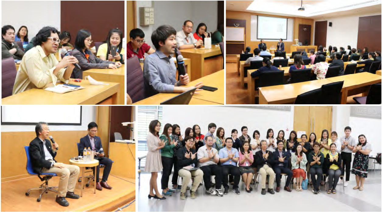
ครั้งที่ 14 อธิการบดีพบประชาคมสำนักหอสมุด และสถาบันการเรียนรู้ ในวันศุกร์ที่ 13 ธันวาคม 2562 เวลา 13.30 – 15.30 น. ณ ห้อง LIB114 ชั้น 1 สำนักหอสมุด