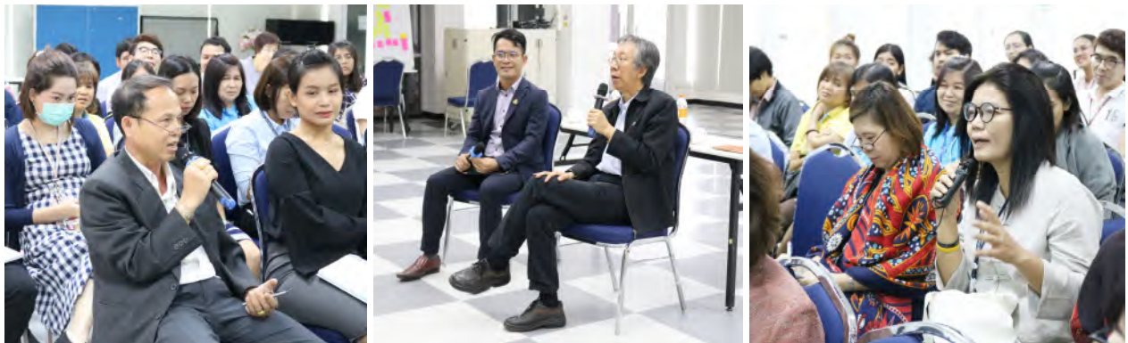
ครั้งที่ 6 อธิการบดีพบประชาคมสำนักงานอธิการบดี วันศุกร์ที่ 13 กันยายน 2562 เวลา 13.30 – 15.30 น. ณ ห้องประชุม 4/2 ชั้น 4 คณะเทคโนโลยีสารสนเทศ