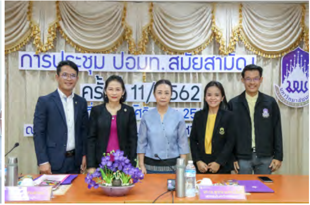
ประชุมประธานสภาอาจารย์มหาวิทยาลัยแห่งประเทศไทย (ปอภท.) สมัยสามัญ ครั้งที่ 11/2562 ในวันอังคารที่ 21 พฤศจิกายน 2562 ณ ห้องประชุมบวร รัตนประสิทธิ์ อาคารสำนักงานอธิการบดี มหาวิทยาลัยพะเยา จังหวัดพะเยา