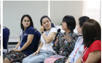
ครั้งที่ 9 อธิการบดีพบประชาคมคณะเทคโนโลยีสารสนเทศ (SIT) วันพฤหัสบดีที่ 10 ตุลาคม 2562 เวลา 13.30 – 15.30 น. ณ ห้องประชุม4/2 ชั้น 4 คณะเทคโนโลยีสารสนเทศ