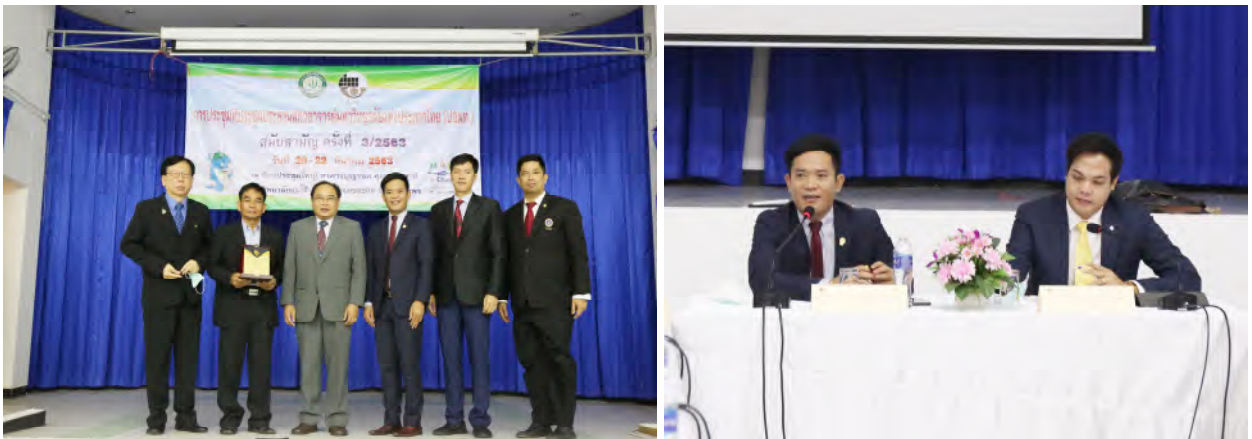
ประชุมประธานสภาอาจารย์มหาวิทยาลัยแห่งประเทศไทย (ปอมท.) สมัยสามัญ ครั้งที่ 3/2563 ในวันเสาร์ที่ 21 มีนาคม 2563 ณ ห้องประชุมใหญ่ อาคารบูรอรอด ศุภอุดมฤกษ์ มหาวิทยาลัยแม่โจ้-ชุมพร