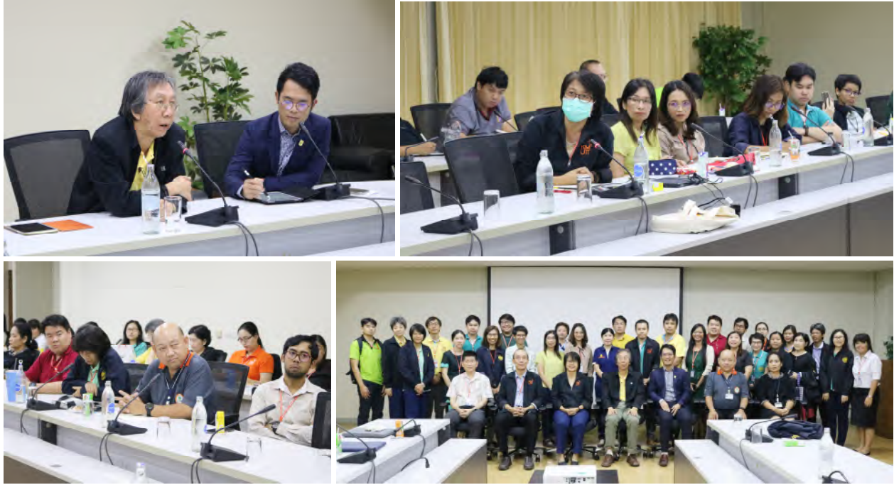
ครั้งที่ 11 อธิการบดีพบประชาคมสำนักคอมพิวเตอร์ วันพุธที่ 30 ตุลาคม 2562 เวลา 14.00 – 16.00 น. ณ ห้องประชุมประกาย ประจักษ์ศุภนิตี ชั้น 9 อาคารสำนักงานอธิการบดี