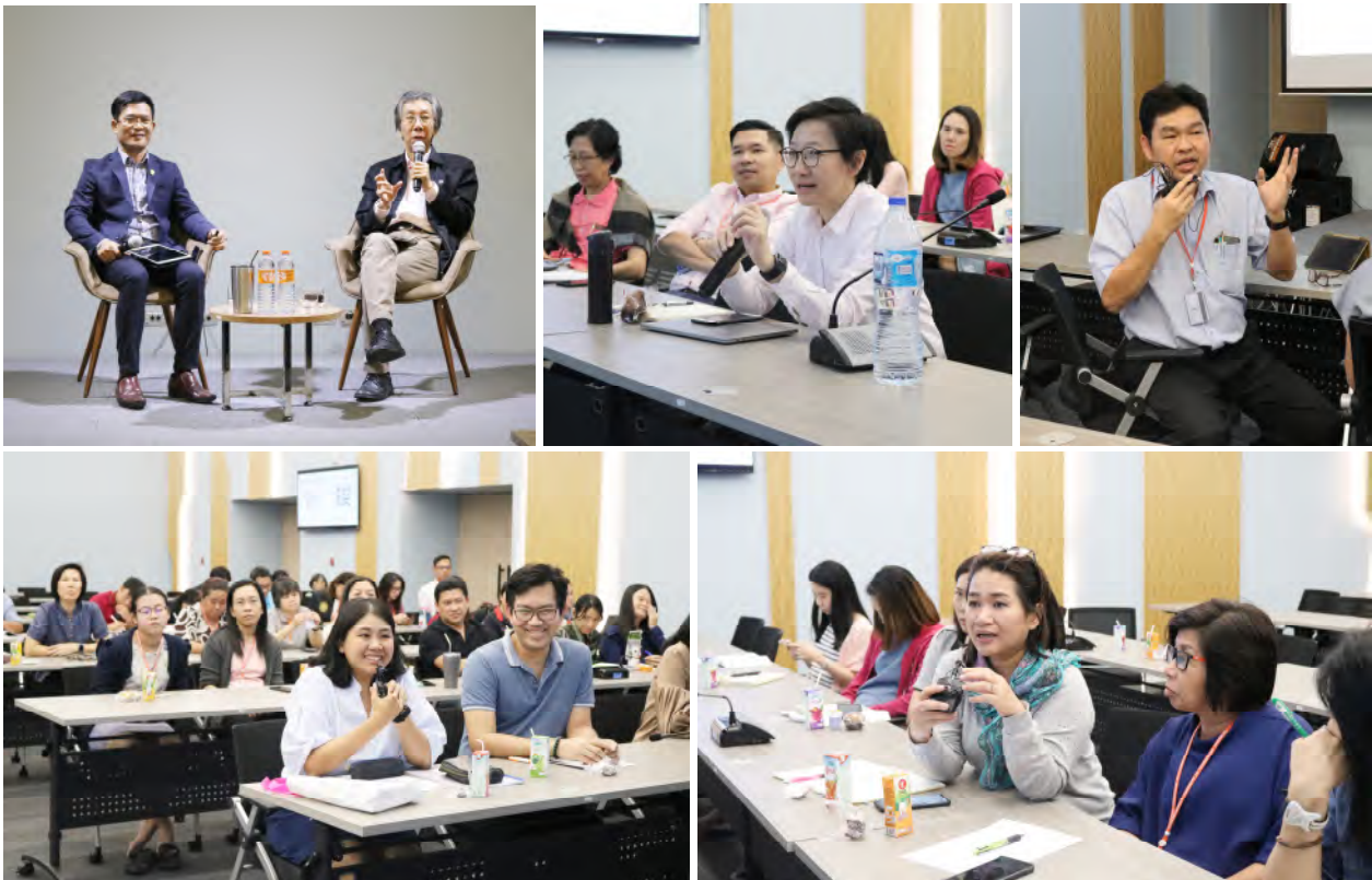
ครั้งที่ 15 อธิการบดีพบประชาคม มจร.บางขุนเทียน วันอังคารที่ 3 ธันวาคม 2562 เวลา 13.30 – 15.30 น. ณ ห้องประชุม BRI 205 ชั้น 2 อาคารวิจัยและ นวัตกรรมกระบวนการชีวภาพ (BRI) มจร.บางขุนเทียน