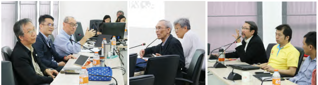
ครั้งที่ 5 อธิการบดีพบประชาคม มจร.ราชบุรี วันพุธที่ 11 กันยายน 2562 เวลา 10.00 – 12.00 น. ณ ห้องประชุม ชั้น 4 สำนักหอสมุด