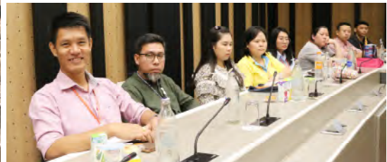
ครั้งที่ 10 อธิการบดีพบประชาคมสำนักบริหารอาคารและสถานที่ วันอังคารที่ 29 ตุลาคม 2562 เวลา 10.00 – 12.00 น. ณ ห้องประชุมประภา ประจักษ์สุนิติ ชั้น 9 อาคารสำนักงานอธิการบดี