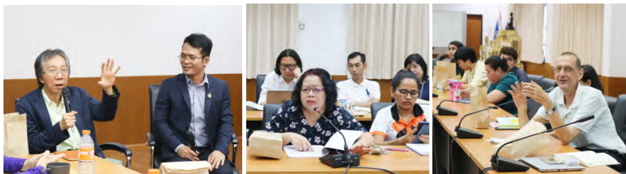
ครั้งที่ 2 อธิการบดีพบประชาคมคณะศิลปศาสตร์ วันพุธที่ 14 สิงหาคม 2562 เวลา 09:30 น. – 11:30 น. ณ ห้องประชุม 901 ชั้น 9 คณะศิลปศาสตร์