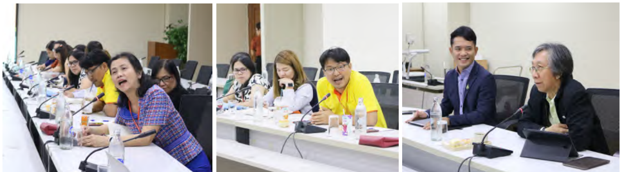
ครั้งที่ 12 อธิการบดีพบสำนักวิจัยและบริการวิทยาศาสตร์และเทคโนโลยี และสถาบันนโยบายวิทยาศาสตร์ เทคโนโลยีและนวัตกรรม วันพุธที่ 6 พฤศจิกายน 2562 เวลา 09.30 – 11.30 น. ณ ห้องประชุมประกาย ประจักษ์ศุภนิตี ชั้น 9 อาคารสำนักงานอธิการบดี