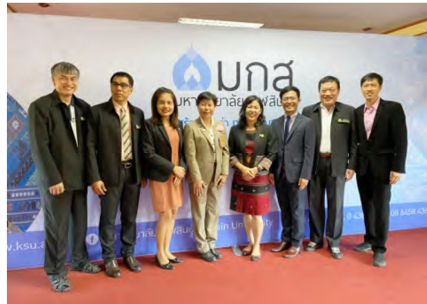
ประชุมประธานสภาอาจารย์มหาวิทยาลัยแห่งประเทศไทย (ปอภท.) สมัยสามัญ ครั้งที่ 12/2562 ในวันเสาร์ที่ 21 ธันวาคม 2562 ณ ห้องประชุมลีลาวดี ชั้น 2 อาคารสำนักงานอธิการบดี มหาวิทยาลัยกาฬสินธุ์