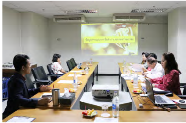
การประชุมคณะทำงานโครงการยกย่องเชิดชูเกียรติบุคลากรที่ปฏิบัติงานในมหาวิทยาลัย 10 ปีขึ้นไป