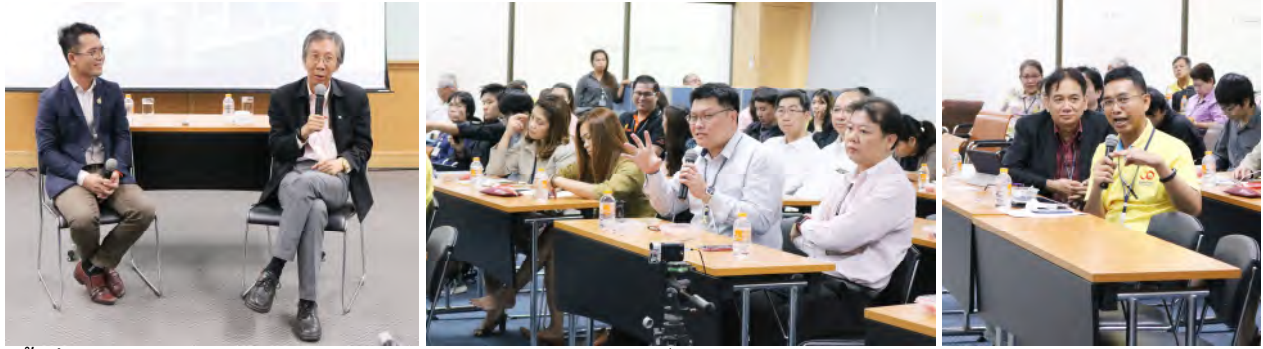
ครั้งที่ 4 อธิการบดีพบประชาคมคณะวิศวกรรมศาสตร์ วันอังคารที่ 10 กันยายน 2562 เวลา 09.30 – 11.30 น. ณ ห้องประชุม คณะวิศวกรรมศาสตร์ ชั้น 2 อาคารเรียนรวม 4