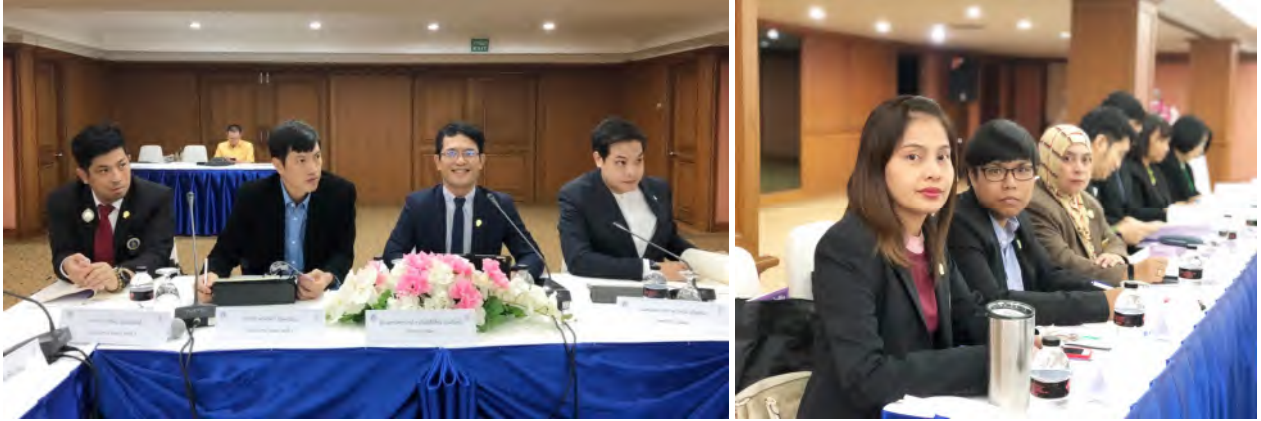
ประชุมประธานสภาอาจารย์มหาวิทยาลัยแห่งประเทศไทย (ปอมท.) สมัยสามัญ ครั้งที่ 2/2563 วันเสาร์ที่ 15 กุมภาพันธ์ 2563 ณ ห้องประชุมฟังก์ พาเลซ โรงแรมเชียงใหม่ ฮิลล์ จังหวัดเชียงใหม่